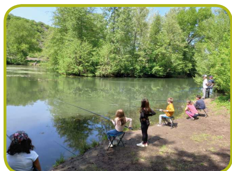
Au bord de l'eau pour s'initier à la pêche...

Le CSC La Pinède a proposé un séjour au parc des Écrins , du 25 au 29 juillet 2022, pour les ados de 9 à 16 ans. Les enfants étaient hébergés dans le joli gîte du Jamivoï, à La Chapelle en Valgaudemar. Au programme: Rafting, accrobranche, veillées à thème, observation des marmottes et des chamois, concours de photos, découverte de cascades, petite randonnée, jeux d'extérieur. De quoi s'émerveiller de la nature et passer une semaine intense et ludique.