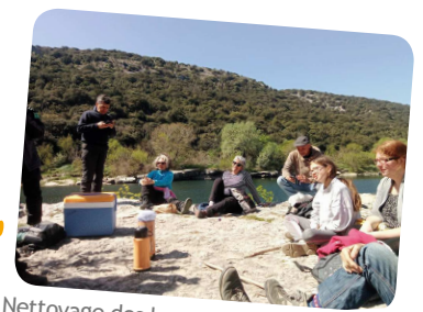
Nettoyage des berges de l'Ardèche avec les bénévoles, en avril 2022.

S'appuyer sur les savoir-faire de chacun, une valeur forte de l'éducation populaire.