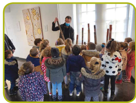
Au musée de Vogüé, pour découvrir l'Art aborigène.