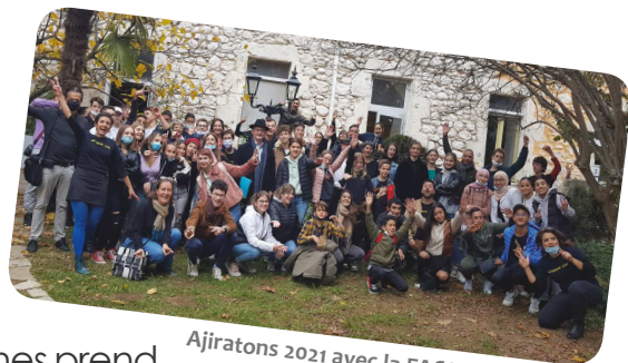
Ajirations 2021 avec la FACS.

Grâce à la création de la PS Jeunes de la CAF, le projet Jeunes prend une dimension tout autre. Les objectifs du projet sont :