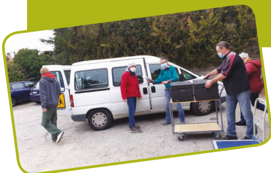
Les bénévoles du relais alimentaire sont à pied d'œuvre un jeudi sur deux à l'espace solidaire Ô point commun.