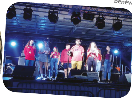
Jeune'n co festival à Saint-Germain, en septembre 2021, festival créé par les jeunes avec le soutien du CSC.