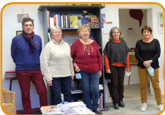
Le Bureau du Centre socio-culturel

Notre établissement s'inscrit dans la proximité, au plus près des habitants de l'intercommunalité. Il se doit d'être un lieu d'initiatives, fédérateur d'énergie, et à l'écoute.