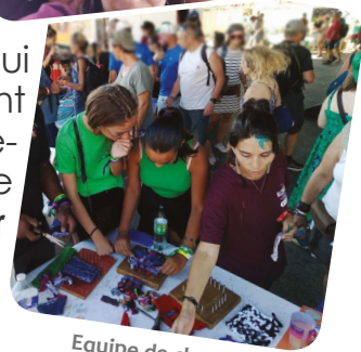
Equipe de choc en juin 2022, au festival Aluna pendant 3 jours, avec les bénévoles enfants, ados, famille, et la ludothèque.