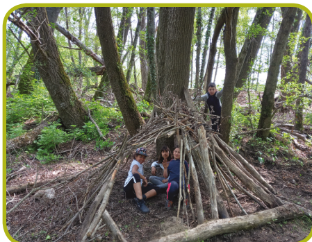
Dans la forêt pour construire des cabanes...