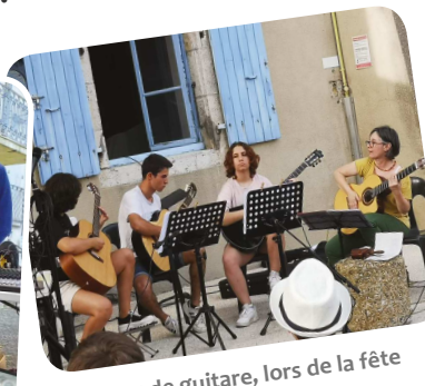
Les élèves de guitare, lors de la fête de la musique 2022.