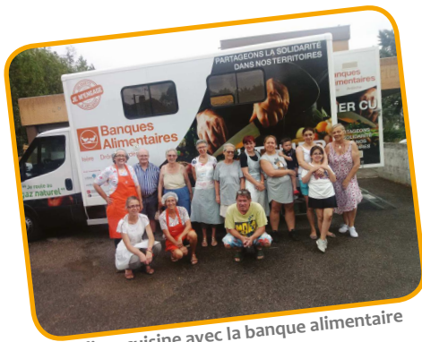
Ateliers cuisine avec la banque alimentaire