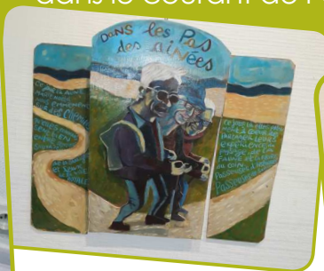
L'exposition «En chemin» du travail de Cassandra, minitieux et poétique, à l'Hôtel Malmazet.