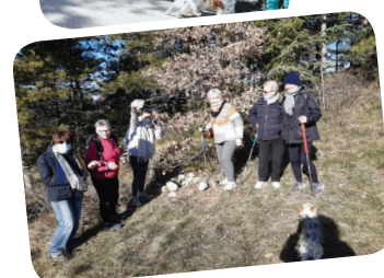
Promenades et géocaching avec l'espace solidaire.