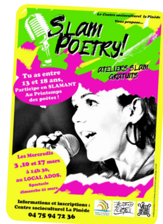
En mars 2021, Le local ados proposait des ateliers SLAM gratuits, en partenariat avec le Printemps des Poètes.

Pour joindre le secteur Culture : s.coordination@csclapinede07.fr 04 75 94 72 36