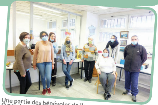
Une partie des bénévoles de l'espace solidaire O point commun.

Plus d'infos sur notre site internet : centresocioculturellapinede.com ou sur notre page facebook :