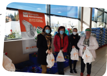
Les bénévoles de l'espace solidaire et de la banque alimentaire lors de la collecte nationale de la banque alimentaire, le 28 novembre 2020.

le bénévolat et l'implication contribuent à la santé et au bien vieillir des seniors. Le CSC avec ses activités dont l'espace solidaire « Ô point commun » est un vivier de ressource bénévoles . La CESF repère et répertorie les savoirs faire, les compétences de chacun et peut mettre en liens les personnes qui le souhaitent avec les associations du territoire. Elle gère aussi en interne l'intégration des nouveaux bénévoles, leurs formations et la gestion de leurs besoins.